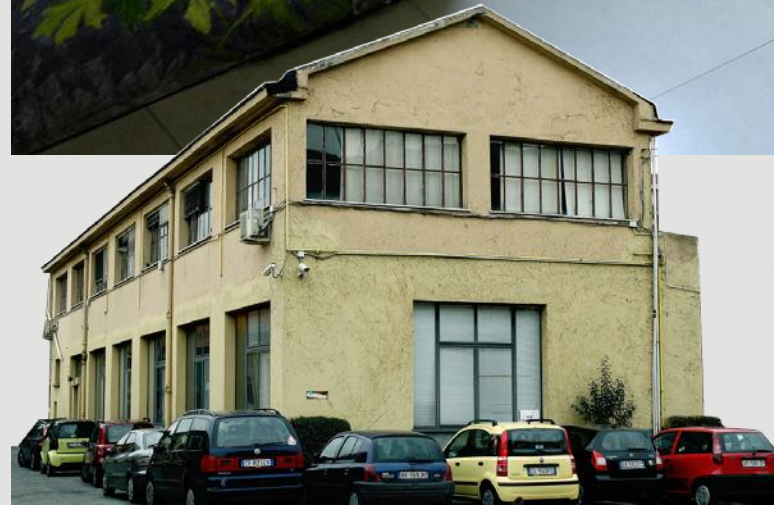
L'ingresso degli uffici con la particolare giungla dipinta a mano